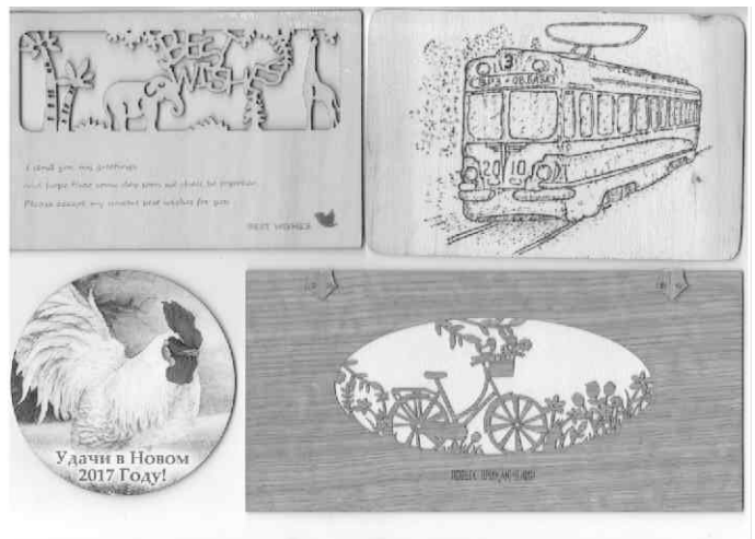
Открытки из дерева

Друзья по хобби живут в Москве, Калуге, Казани, Санкт-Петербурге, Архангельске, Омске, Томске, Красноярске, в городах и селах Краснодарского края, Ростовской, Курской областях и во многих других населенных пунктах – всех не перечислишь. Много друзей в Германии,