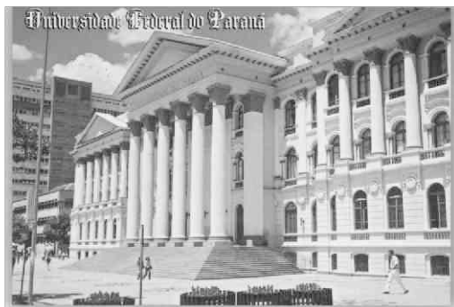
Открытки с университетами мира