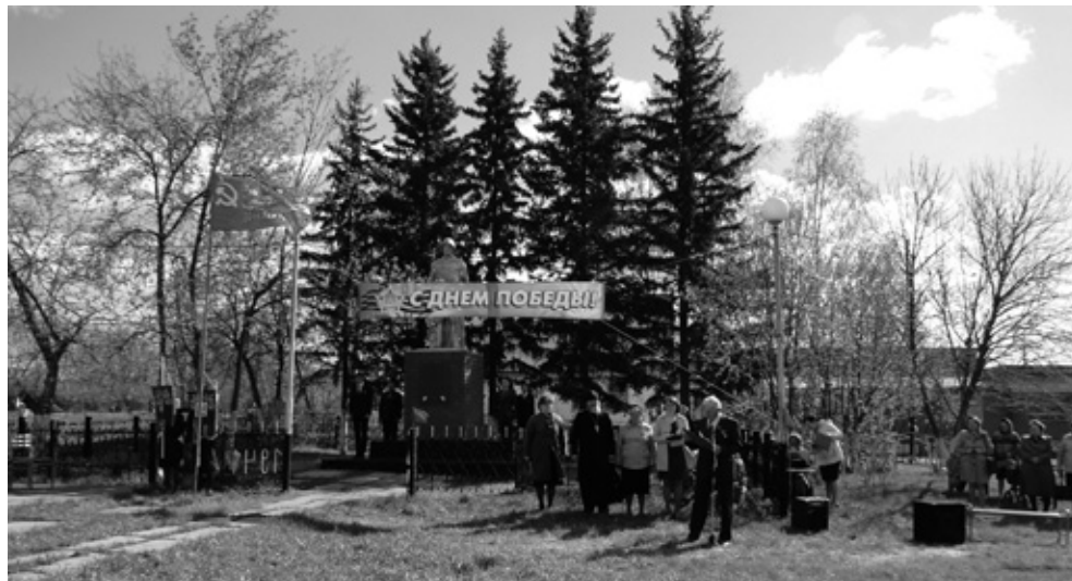
Празднование Дня Победы в селе Сорочий Лог