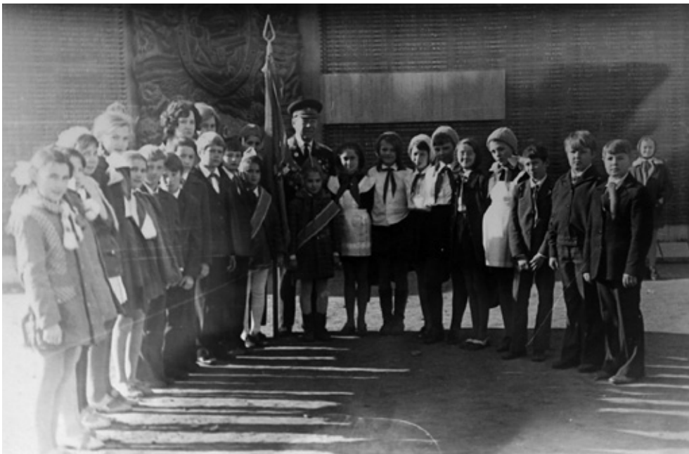
По местам поисковых экспедиций со школьниками