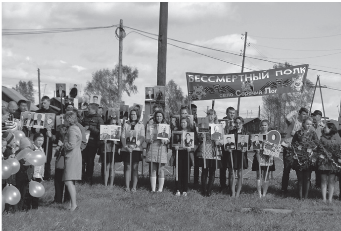
Празднование Дня Победы в селе Сорочий Лог