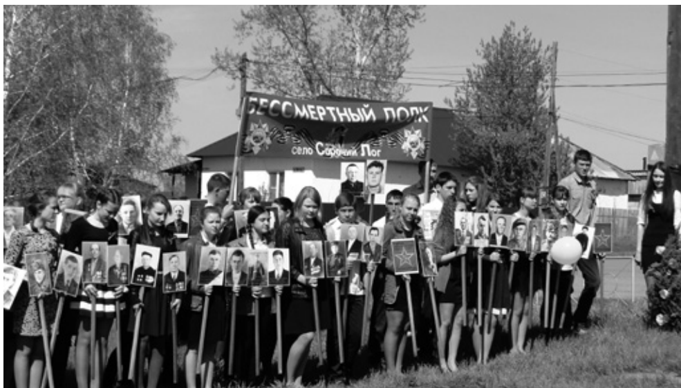
Празднование Дня Победы в селе Сорочий Лог

Ленинградцы приступили к работе в начале уборки