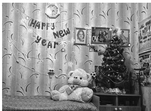
Комната №61 (общежитие №1).