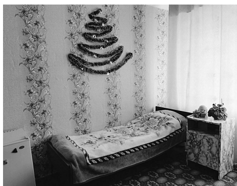
Комната №188 (общежитие №2).

Е жегодный конкурс на лучшую комнату общежитий студенческого городка Алтайского ГАУ прошел 12 декабря. По результатам отбора в финальную часть конкурса вышли семнадцать комнат общежитий вуза. Наибольшее представительство было у общежития №2, от которого в конкурсе принимало участие семь комнат.