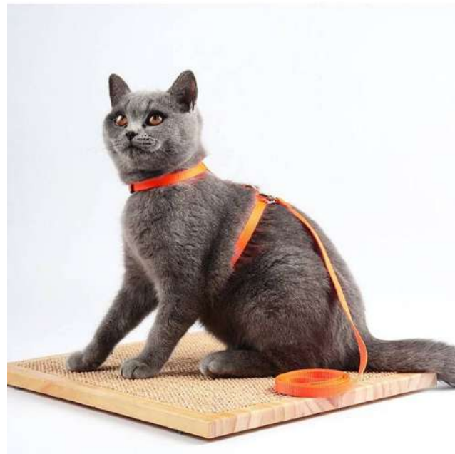
Шлейка с поводком

На основе идеи шлейки, мы несколько переработали и дополнили конструкцию, добавив ремни с фиксаторами, удерживающие конечности.