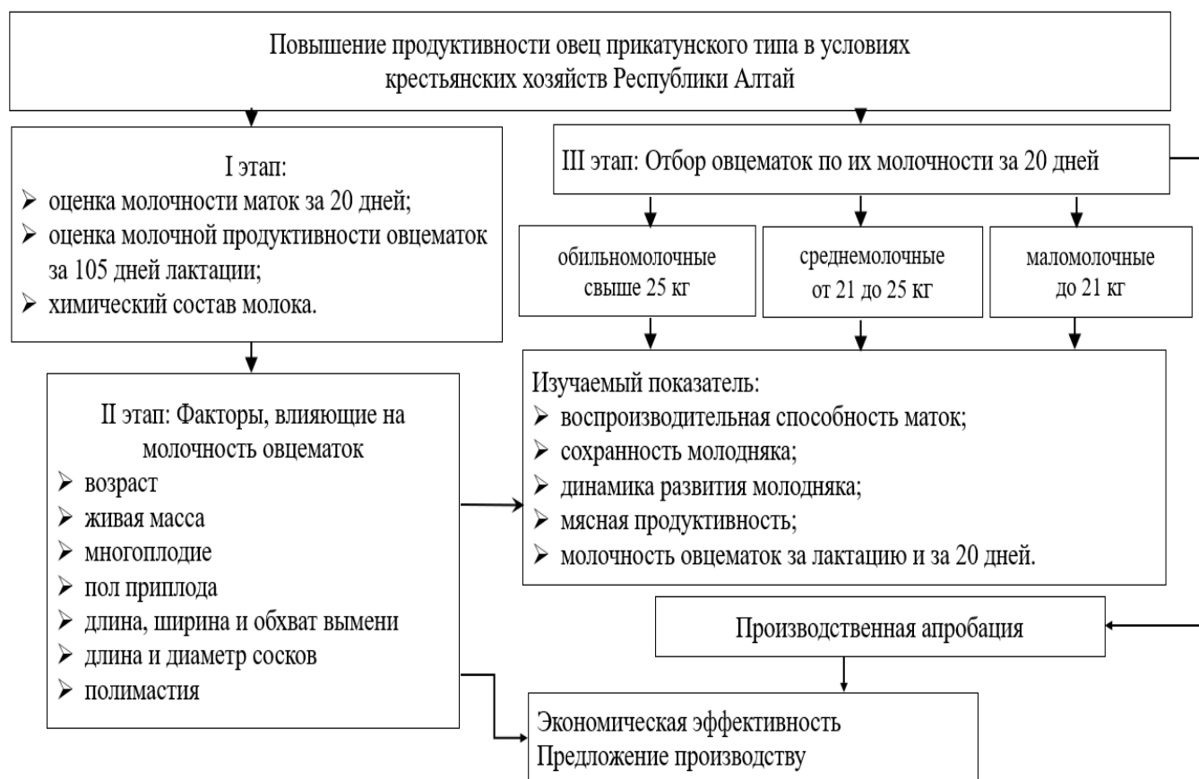
Рисунок 1 – Общая схема исследований

Химический состав молока устанавливали на анализаторе молока Milko Scan FT 120 в лаборатории Сибирского научно-исследовательского института сыроделия на третий месяц лактации. Молоко выдаивали вручную из обеих долей вымени. Определяли сухое вещество, жир, белок, казеин, лактозу, плотность, точку замерзания, кислотность, СОМО, мочевины.