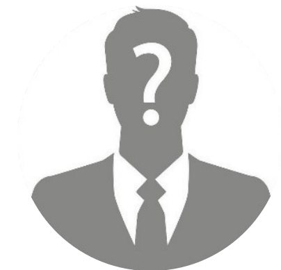
Список менторов уточняется