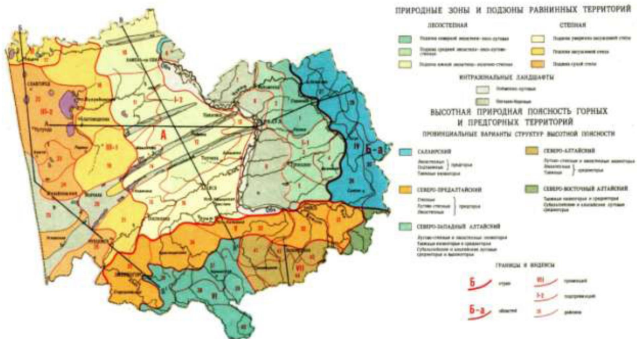
Рис. 1. Физико-географическое районирование Алтайского края (Атлас..., 1975)