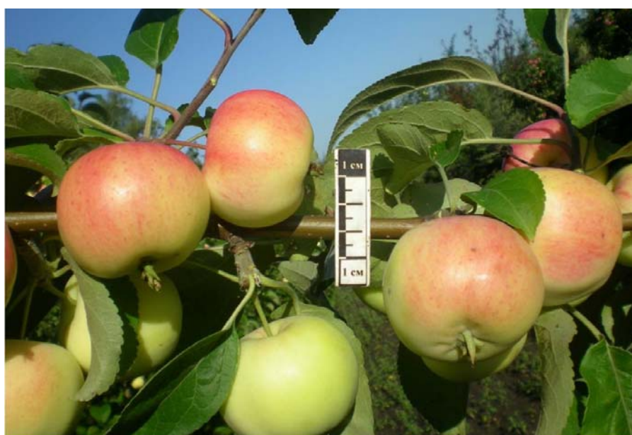
Рис. 2. Сорт Юбилейное Калининой