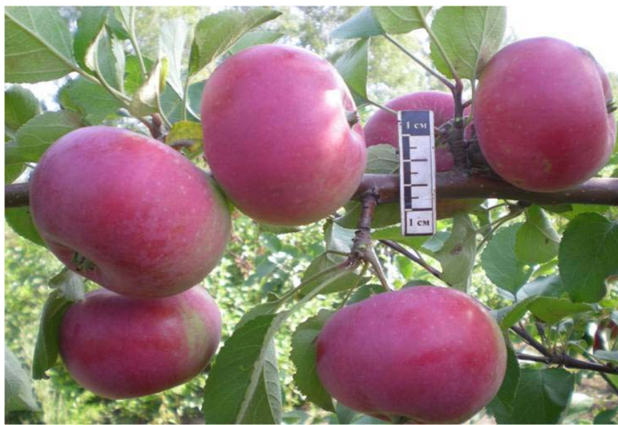
Рис. 1. Сорт Чупинское

вкусовым характеристикам, но и привлекательным внешним видом и консистенцией плодов в готовом продукте. При дегустации натуральных соков без добавления сахара высокую оценку (4,4 балла) получил сок из плодов сорта Чупинское.