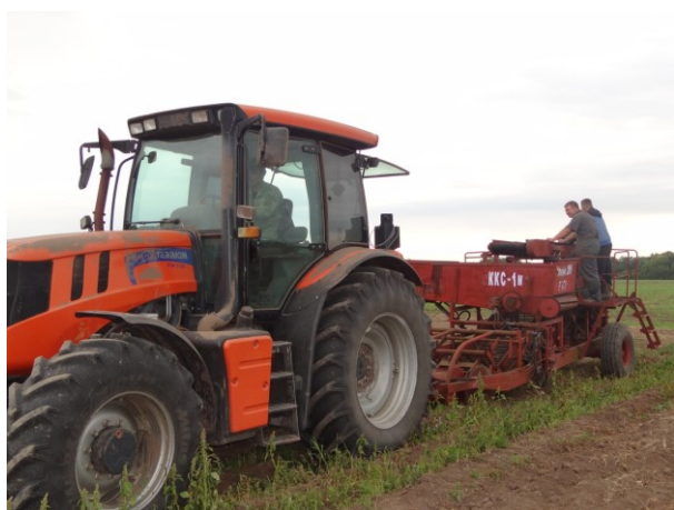
Рис. 1. Уборка картофеля агрегатом TERRION ATM 3180 + ККС-1М

В процессе испытаний комбайна ККС-1М изучался вопрос о влиянии наличия растительных остатков и картофельной ботвы на показатели качества работы комбайна. Для этого с пяти дополнительных учетных делянок с поверхности поля вручную собрали растительные остатки, а чтобы не нарушить связь клубней с корнями и не взрыхлить гребни, оставшиеся после уборки, стебли ботвы срезали на уровне почвы.