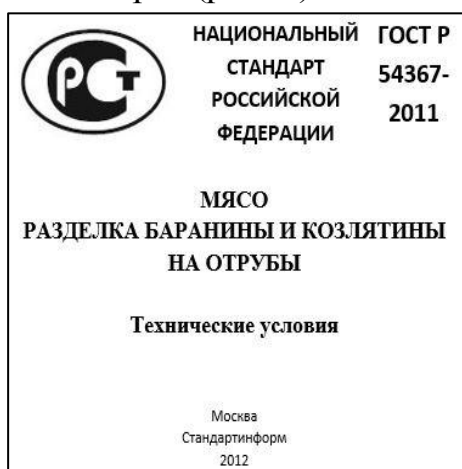
Рисунок 1 – Титульный лист стандарта

Задача 4 Оценить правильность оформления библиографических данных стандарта (рис. 4).